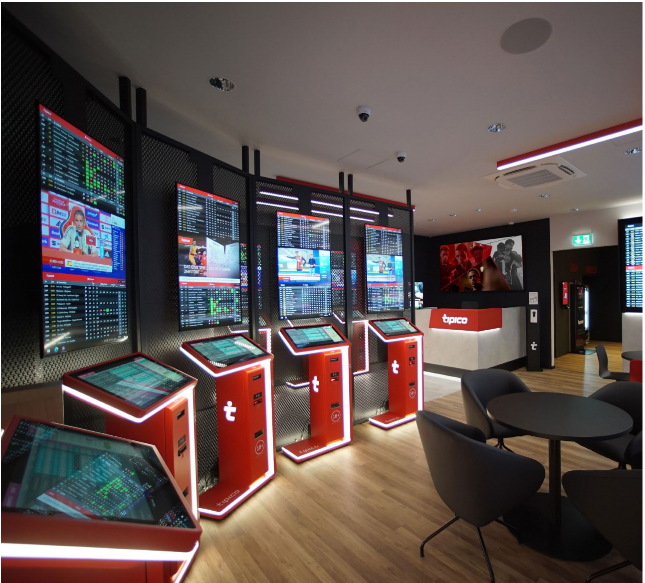
Offenbach am Main