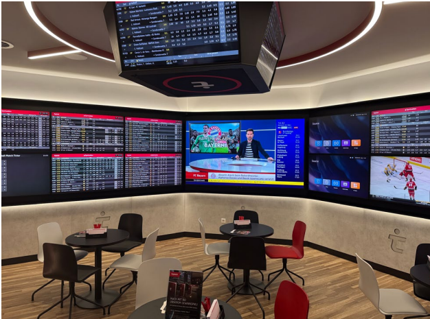
Offenbach am Main